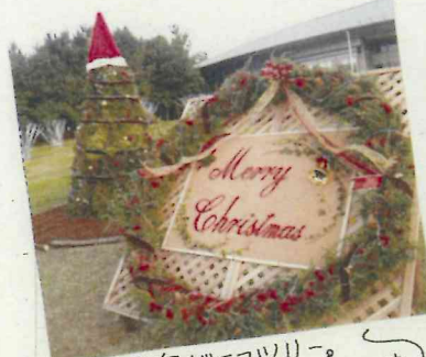
※ 奥がエコツリー。手前が巨大リースです。