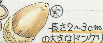
長さ2~3cmの大きなどんぐり

どんぐりとはブナ科の木の実の事を言います。 スポーツ公園には様々な木が植えられていて、どんぐりの生る木も10種類以上あります。今回は公園のどんぐりの木を紹介します!