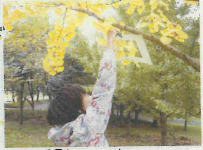
※風景を切り取り中。

11月13日(日)は、お昼までに雨が降り地面がぬれてしまったので、外で活動した後、室内で工作を行いました。「森の美術館」では様々な額の中から一つ選び、園内の景色や気に入った